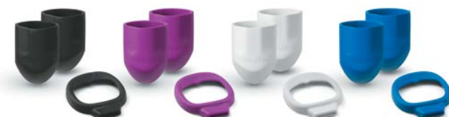
Schutzkappen für Handgriffe und Sichtfenster der Welch Allyn Pocket LED

Individuelle Kombinationsmöglichkeiten mit unserem Zubehörkit*